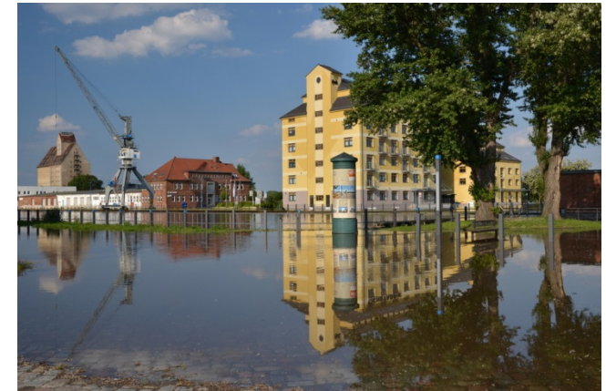
ifak im Wissenschaftshafen Magdeburg